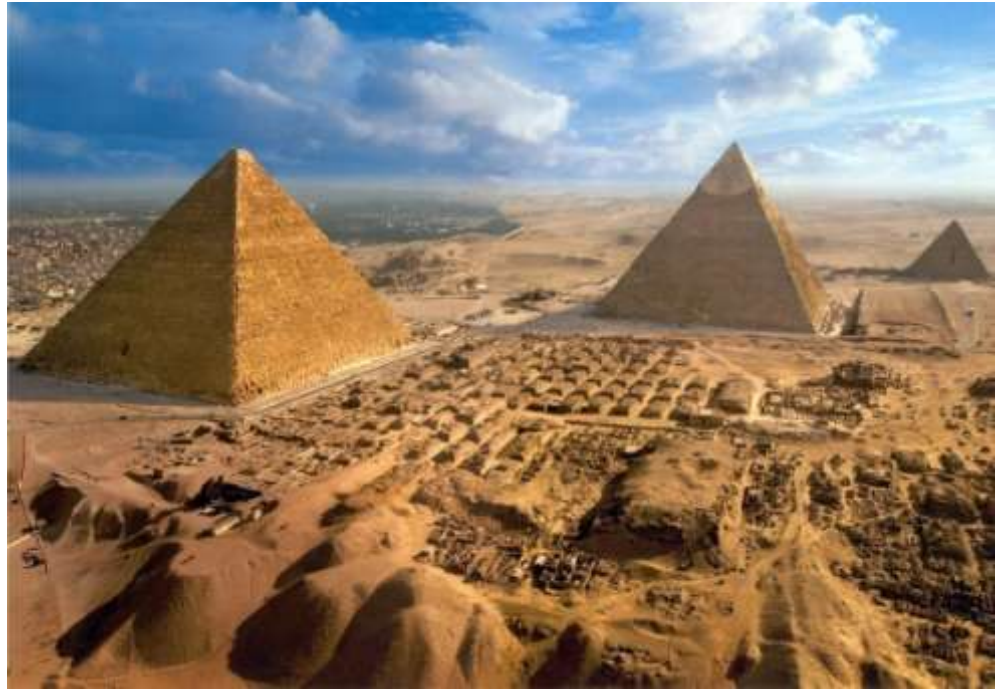
La necropoli di Giza con le piramidi di Cheope, Chefren e Micerino