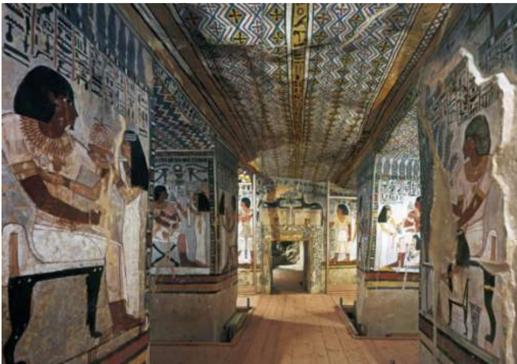
La camera funeraria della tomba di Sennefer è ricca di decorazioni con scene legate alla vita e alle sue gioie.