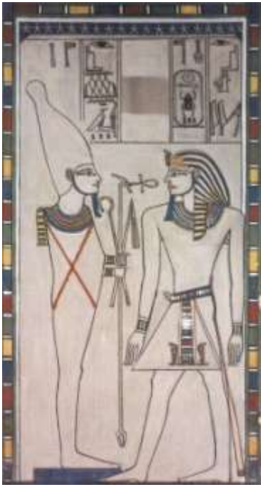
Il dio Osiride porge l'Ankh, simbolo della vita, al faraone (tomba di Amenhotep II).